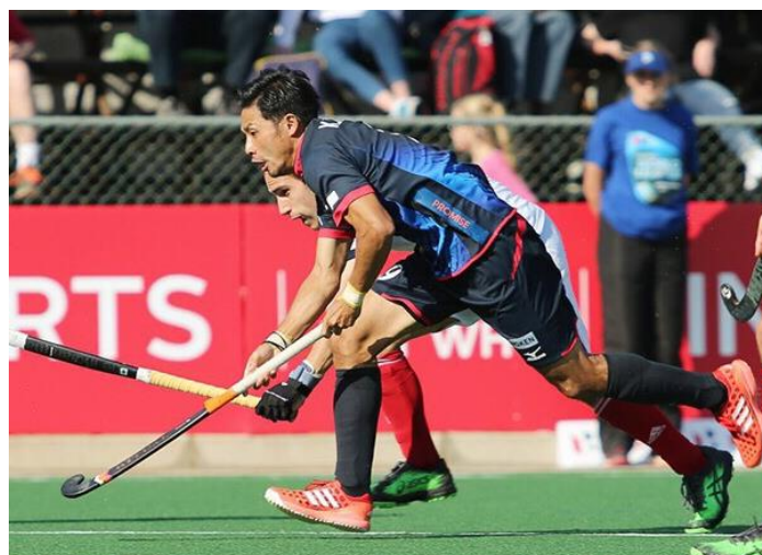
オランダリーグで活躍する日本代表 田中健太選手